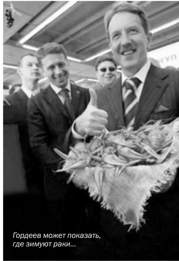
Гордеев может показать, где зимуют раки...

В марте 2008 года на президентских выборах победил