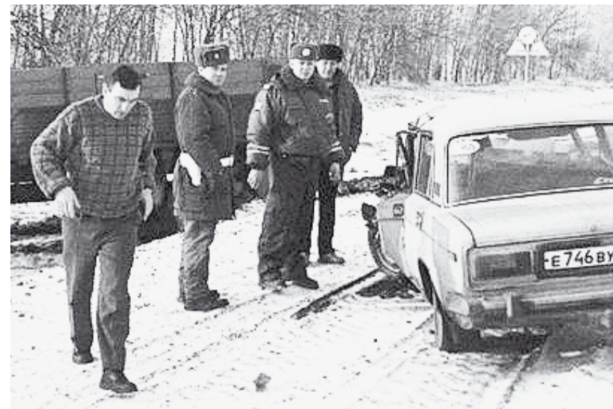
Очередная авария на автомагистрали «Дон».

За январь в области произошло 228 дорожно-транспортных происшествий: 26 человек погибли и 268 получили ранения. Рекордсменом по ДТП стал Коминтерновский район – 29.