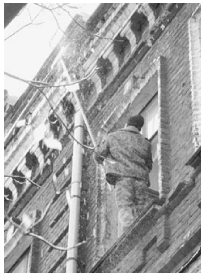
Сбивать сосульки - эта работа, судя по всему, тоже попадает в разряд общественных.

Возможной ахиллесовой пятой этой программы является то, что квалифицированным работникам предлагают вакансии уборщиков, сторожей и грузчиков. Естественно, что не каждый на это пойдет. Пока только около тысячи человек изъявили желание перейти на временную работу.