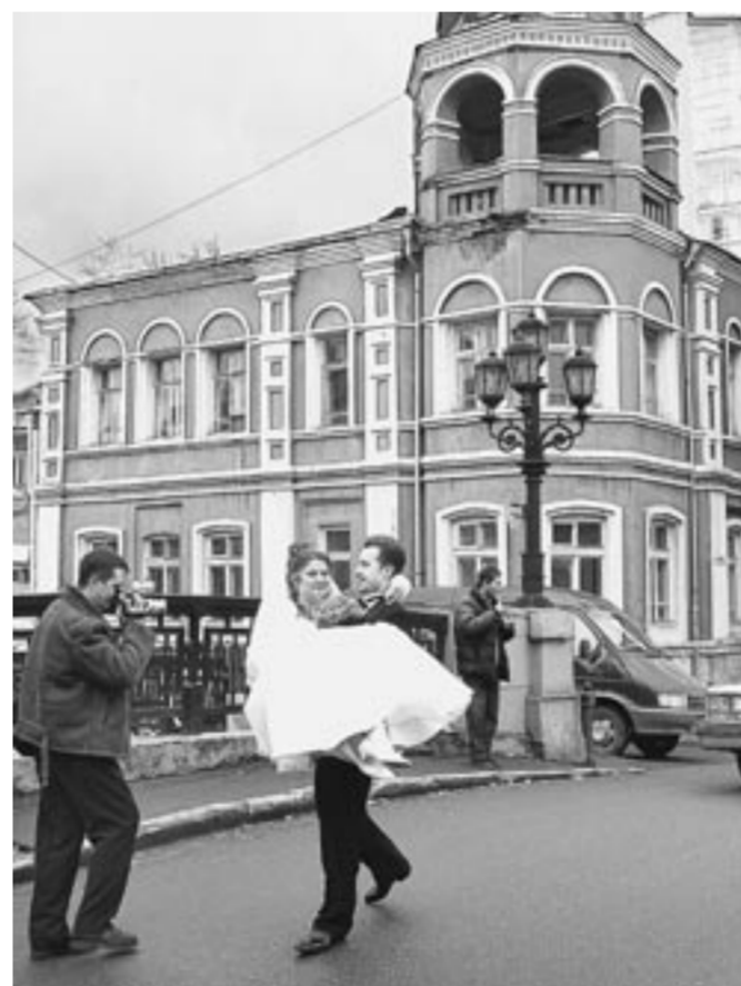
Каменный мост в Воронеже – своего рода «талисман» для новобранцев. Но гарантирует ли он счастливую семейную жизнь?

Существуют даже специальные упражнения, которые, как считают психологи, помогают желаниям сбываться.