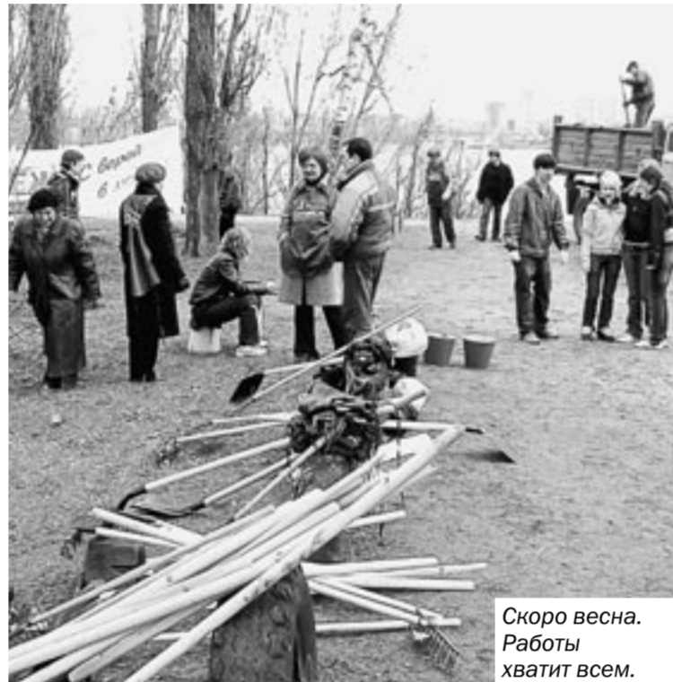
Скоро весна. Работы хватит всем.

Через разбитые стекла окон на лестничной площадке зимняя вьюга наметает сугробы снега к входным дверям лифтов и квартир. И требуется всего лишь малость: забить хотя бы картонкой разбитый оконный приём, а может быть, «сброситься» и вставить стёкла. Но опять это пресловутое: «Конечно, можно, но...».