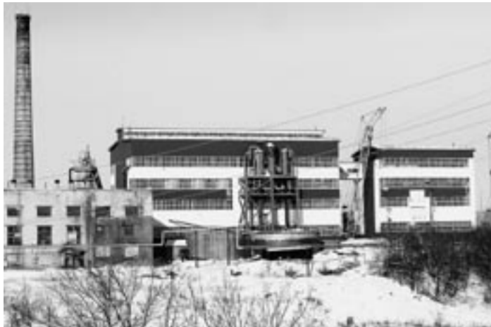
Новый цех сахарного завода.

Грибановскому сахарному заводу исполнился 161 год. За счёт реконструкции и ввода в эксплуатацию новых цехов — продуктового, упаковочного — старейшее в области предприятие смогло в нынешнем сезоне удвоить объёмы переработки свёклы и доставить их до 200 тысяч тонн, увеличить производство сахара с 13 до 26 тысяч тонн. И это не предел возможного, считают на заводе. За счёт ввода в эксплуатацию новой диффузии, а работы уже ведутся, сахаровары рассчитывают в нынешнем году поднять среднесуточную мощность до 3000 тонн, что в несколько раз больше, чем было в Грибановке раньше.