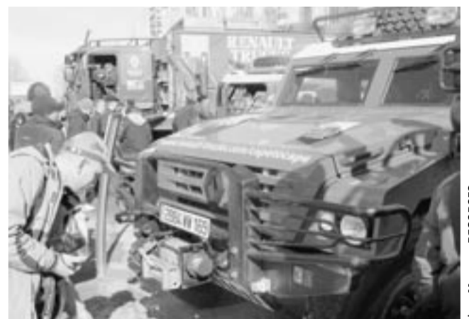
Подготовлено по сообщениям информационных агентств, пресс-служб и корреспондентов «Коммуны».