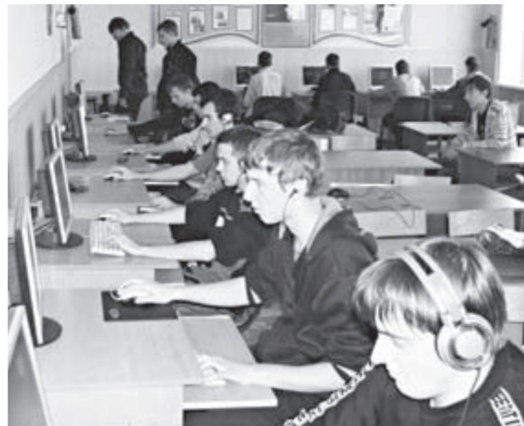
Будущие хлебопеки дружат с компьютером.