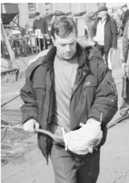
Можно купить и саженцы, и мини-технику.

Технику и технологии различных направлений представляют производители из Воронежа, Москвы, Санкт-Петербурга и других регионов России. Сельхозтехнику для ведения полевых работ демонстрируют фирмы-производители из Канады, Японии и Белоруссии, а компании из Франции и Германии - животноводческое оборудование.