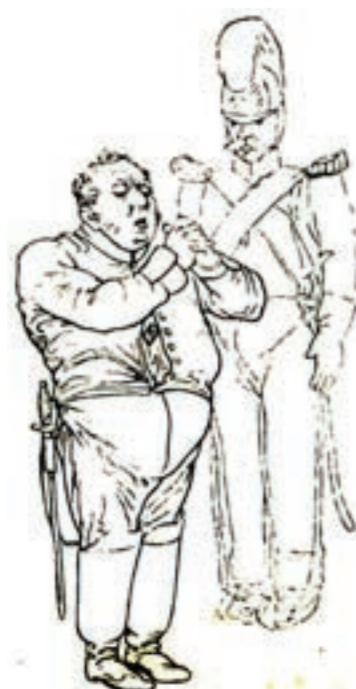
Михаил Щепкин в роли Городничего.

Заметим, что если в советское время пьесы А.Н. Островского и М. Горького почти постоянно значились в афише нашего старейшего театра, то Гоголь был редким гостем. Впрочем, с 1939 по 1951 годы «Ревизор» трижды появлялся на сцене.