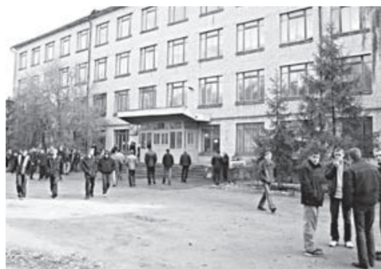
Здесь растут специалистов нового уровня.

У колледжа есть бесспорные преимущества. Во-первых, местным ребятам не надо уезжать в дальние края в поисках достойного образования. Все, что нужно для получения востребованных на рынке профессий - механиков, строителей и электриков, - в колледже есть. Во-вторых, уровень подготовки отвечает современным требованиям, и выпускники колледжа легко находят себе