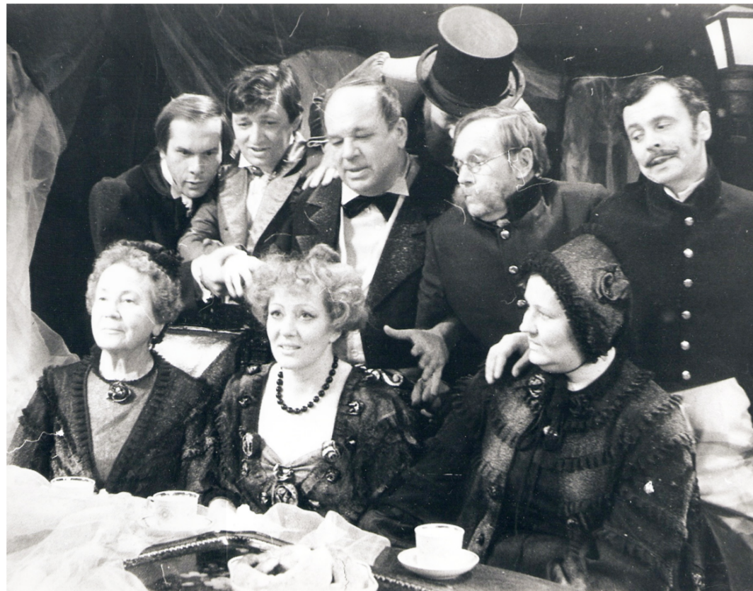
«Женитьба» на воронежской сцене.