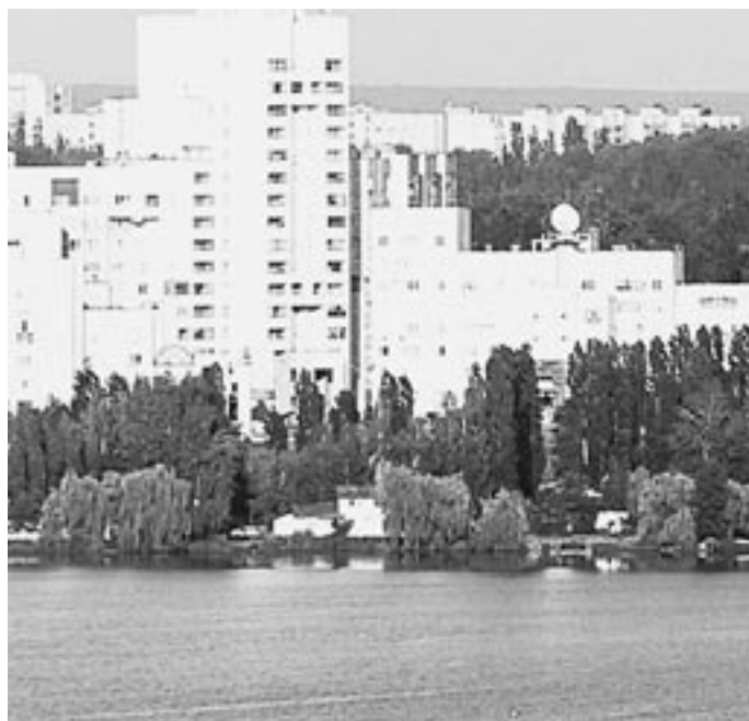
Город у воды должен быть с водой.

Остается надеяться, что усилия властей и антикризисной команды «Водоканала» увенчаются успехом, и, наконец, будет найдено разумное решение, удовлетворяющее потребности кредиторов, и в первую очередь, нас – горожан.