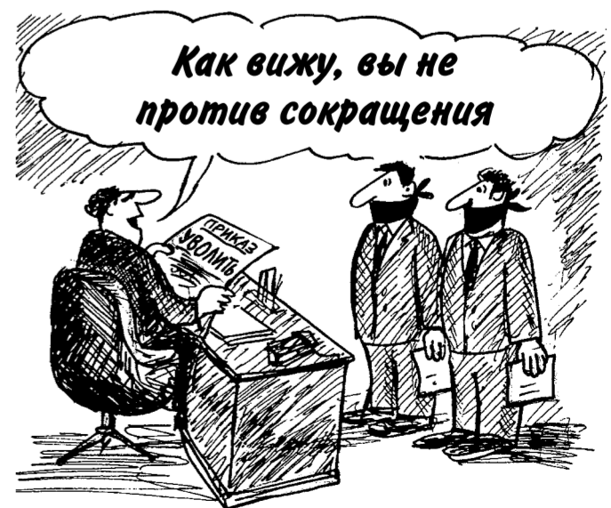
ВСЕГДА НА ЭТОМ МЕСТЕ