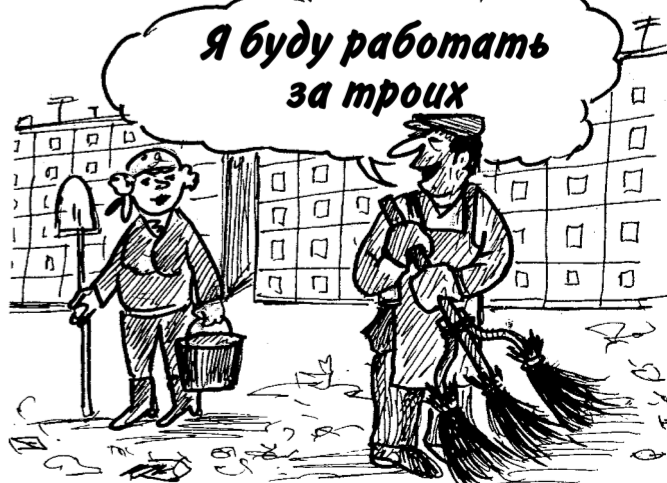
ВСЕГДА НА ЭТОМ МЕСТЕ