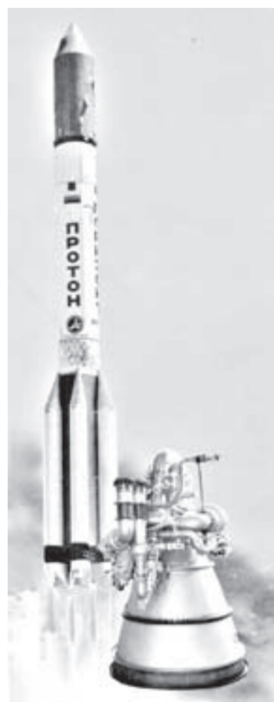
Двигатели «Протон» - детище Воронежского механического завода.

- А другого пути у нас просто нет. Кстати, если в 2007 году заводом было выпущено продукции на 2,5 миллиарда рублей, то в прошлом - уже на 3,5 миллиарда. Планируем, что и в этом году прибавка составит ещё один миллиард рублей. Но самое важное и примечательное другое. Доля жидкостных ракетных двигателей ныне составляет уже 70