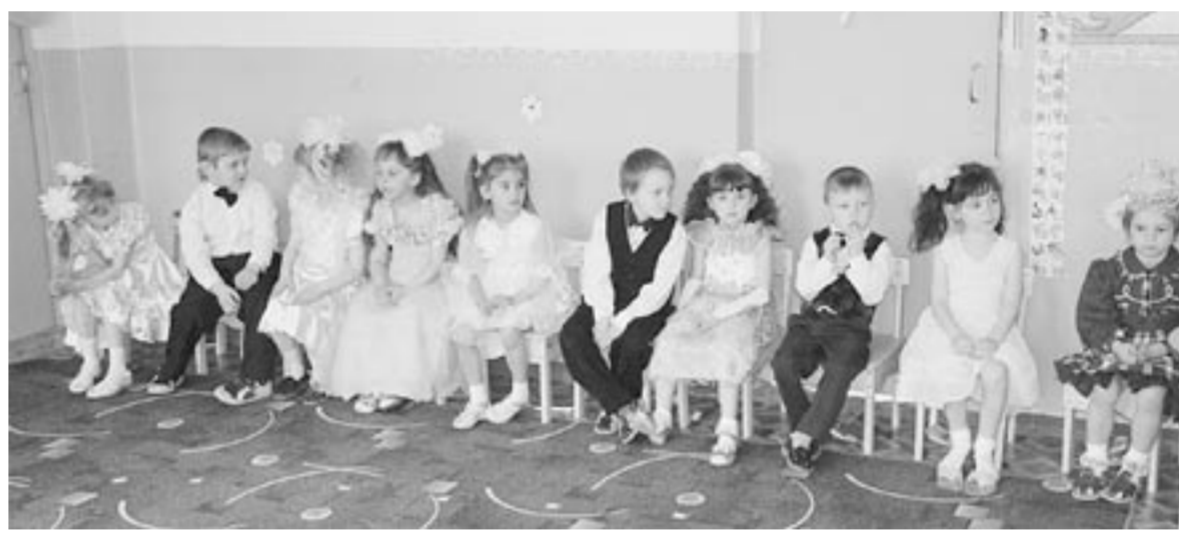
Открытие садика – праздник для малышей и взрослых.

– Спасибо родителям, пришли на помощь, – благодарит одноклассник