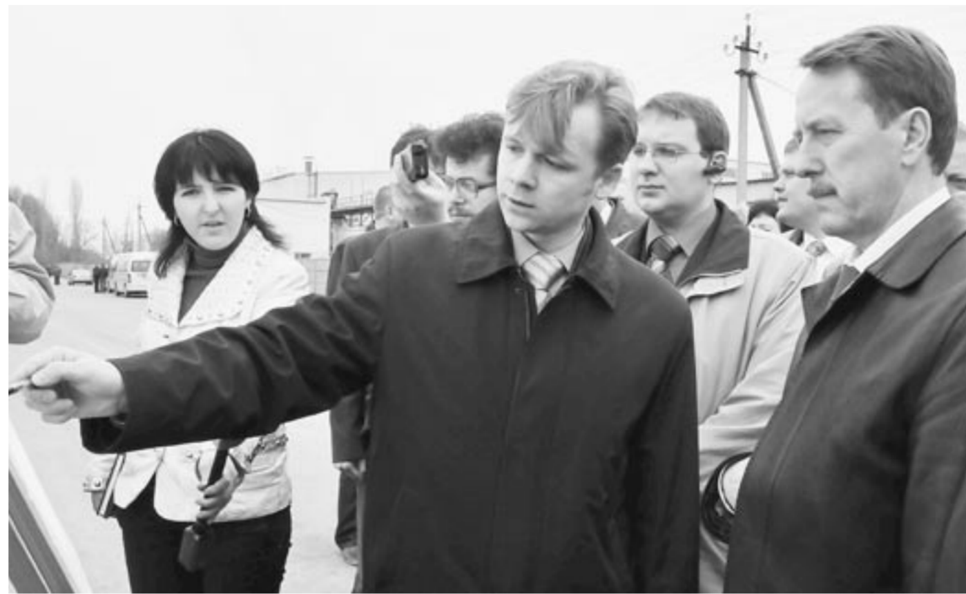
В Верхнехавском районе губернатор познакомился с проектом комплекса по переработке подсолнечника.

Вопрос строительной политики и проблемы промышленного сектора области были в центре внимания во время рабочей поездки губернатора Алексея Гордеева в Подгоренский район, которая состоялась 18 апреля. Завершение строительства новой школы на 1200 мест очень важно для района, поскольку это здание сможет собрать учеников трех подгоренских школ, которые давно уже требуют расселения.