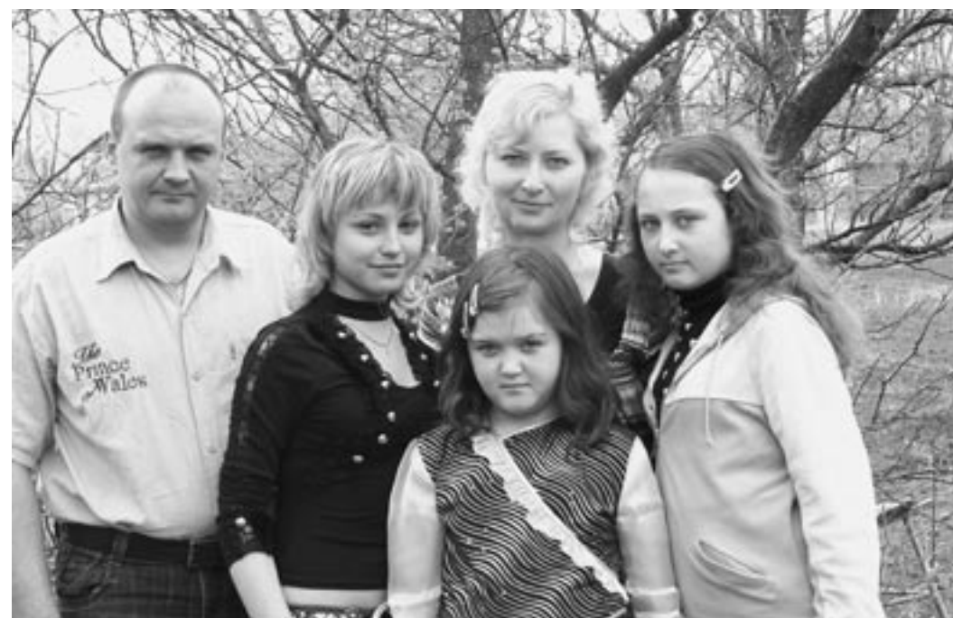
Поспеловы для Эллы давно стали родными.