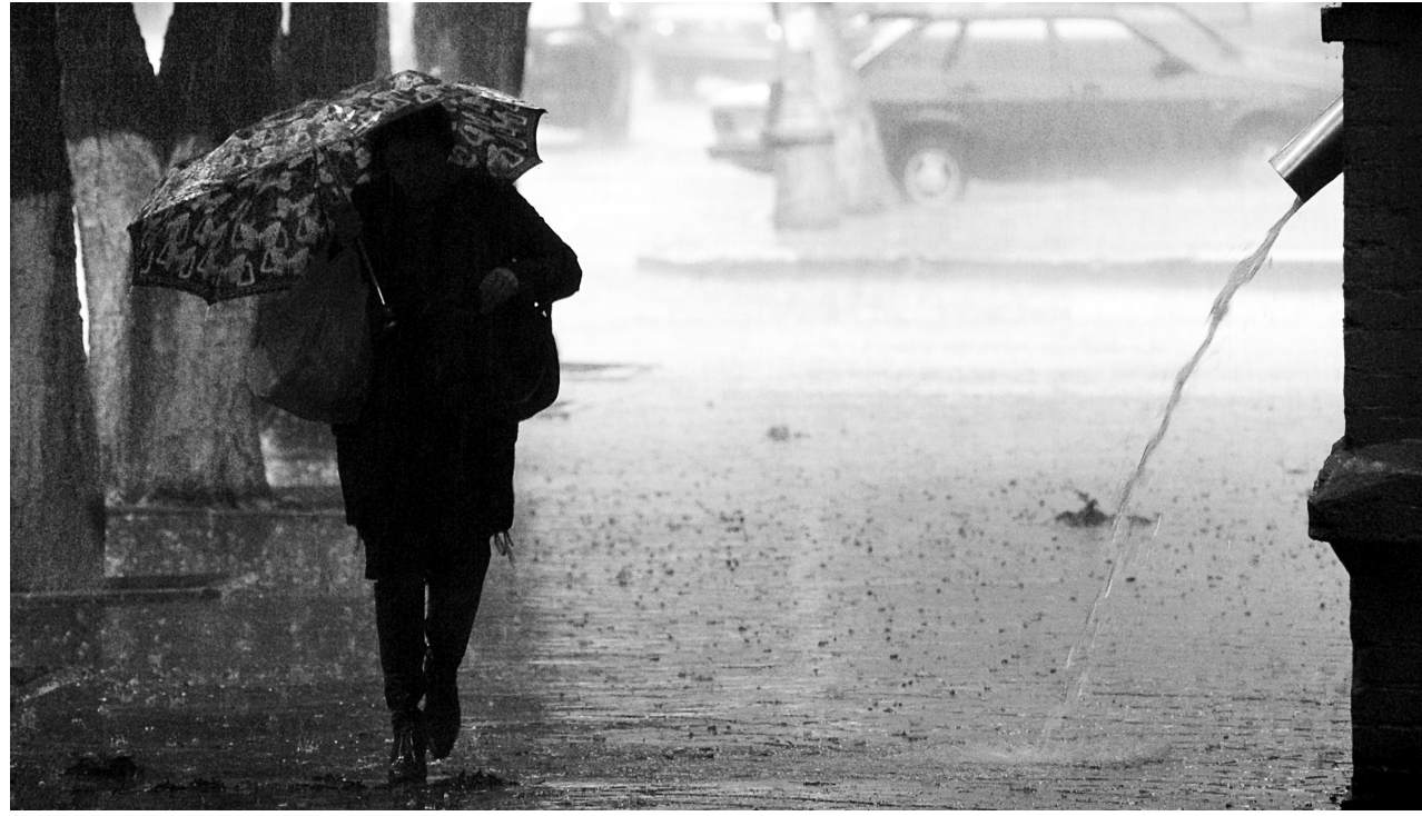
Этот снимок наш фотокорреспондент Константин Толоконников сделал позавчера в Воронеже.