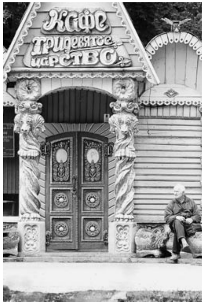
Это кафе хорошо вписалось в облик парка «Орлёнок».

Работы в «Орлёнке» развернулись в апреле. Согласно дизайнерскому проекту пешеходные зоны будут устилаться тротуарная плитка, всю территорию парка украсят новые фонари. На радость детворе в