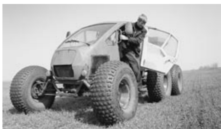
Тракторист Николай Лохай работает на машине с шинами сверхнизкого давления.

ОАО «Днепробугское» для внесения удобрений на низинных участках использует машины на пневмоходу. Разработанная Белорусским заводом внедорожной техники машина на пневматических шинах-оболочках сверхнизкого давления способна передвигаться на тех участках, где обычная техника бессильна. Тракторист может развить скорость более 50 км/ч, при этом внести удобрения на 110 га в день.