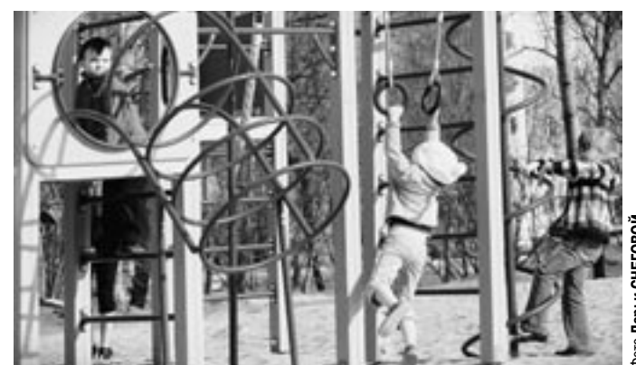
Побольше бы таких площадок в наших дворах!

Пресс-центр губернатора и правительства области.