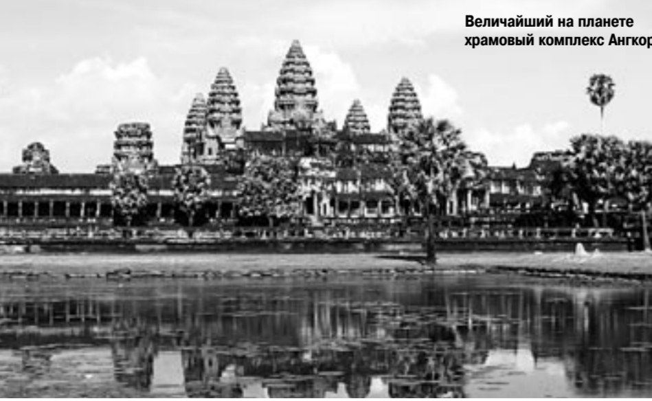
Величайший на планете храмовый комплекс Ангкор

Перед гуманитариями стоят столь же сложные и интересные задачи. Многие люди, к примеру,