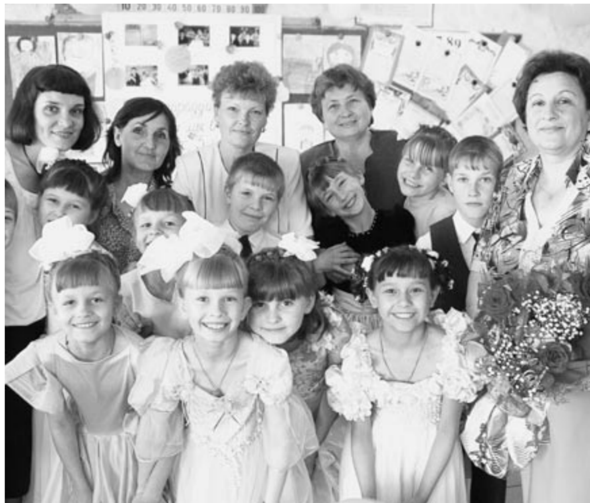
Поздравляйте дружно нас - перешли мы в пятый класс!