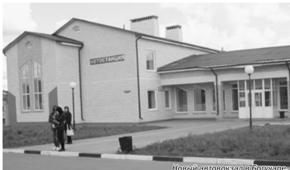
Новый автовокзал в Богучаре.

Прибыль предприятия складывается за счёт выполнения заказов на аренду техни-