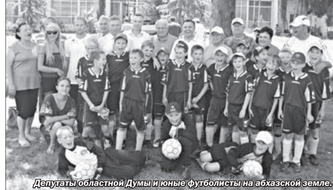
Депутаты областной Думы и юные футболисты на абхазской земле.

Как известно, в августе 2008 года Российская Фе-