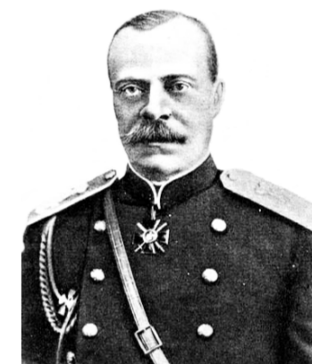
Принц А.П. Ольденбургский.