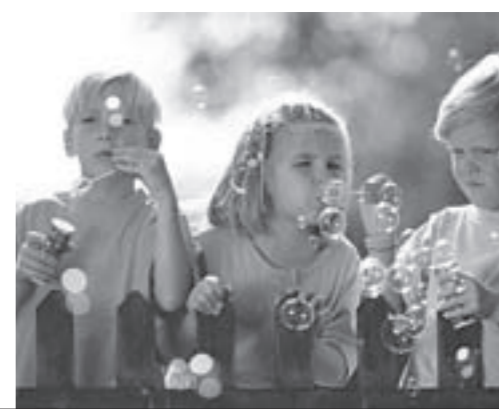
Летние каникулы — это радость только для нашей детворы. У нас, у родителей, в это время голова занята целым ворохом проблем: как подготовить детей к очередному учебному году, чем занять их и куда, наконец, девять столько свободного времени?