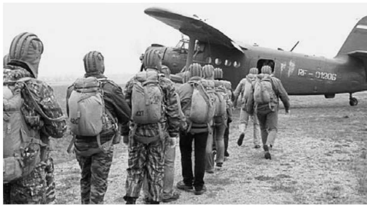
Из истории ДОСААФ: тысячи молодых людей свой путь в небо начинали в секциях добровольного общества.

В центральном совете РОСТО вошли военные чиновники, пред-