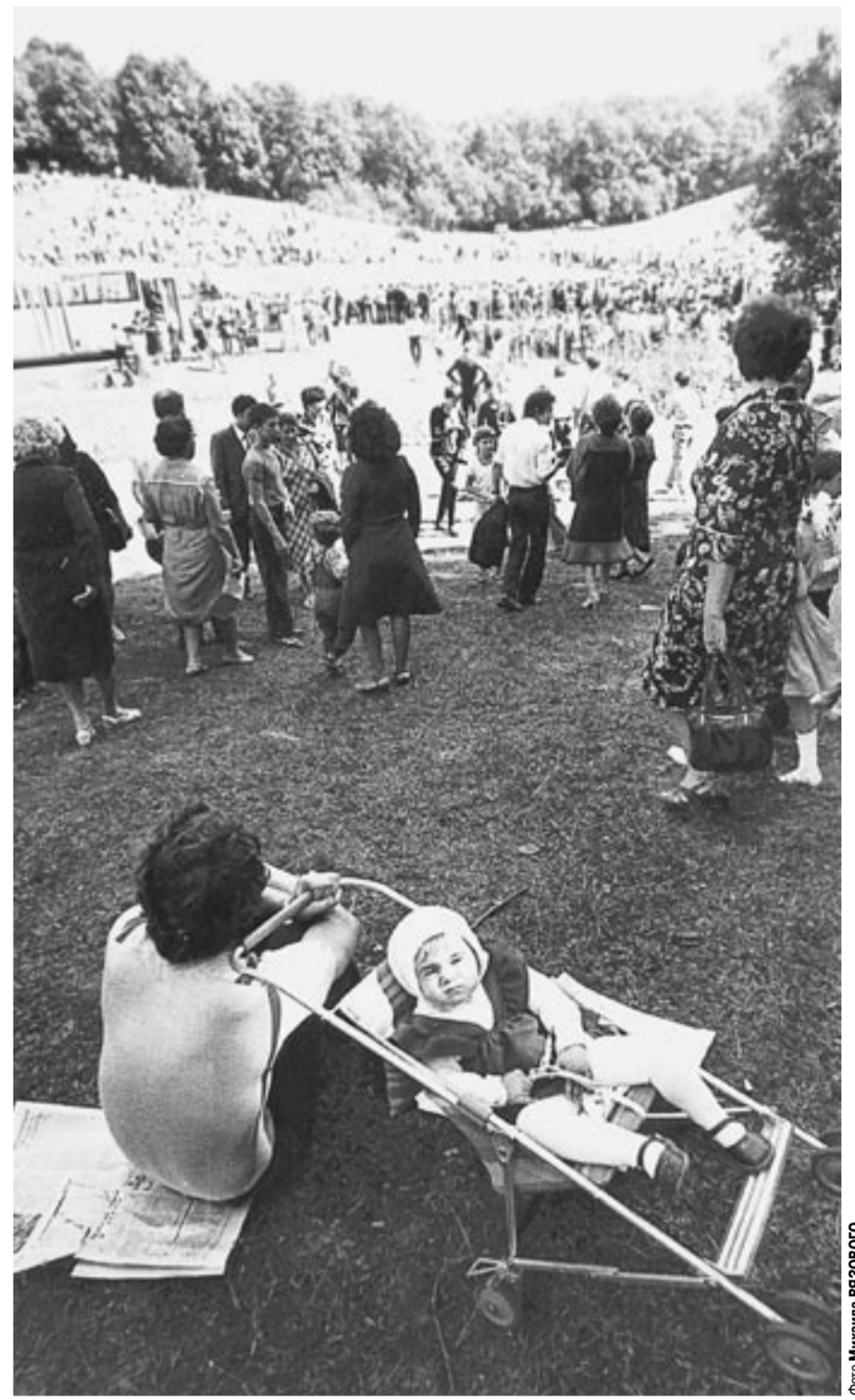
В 60-70-е годы парк «Динамо» был любимым местом отдыха воронежцев.