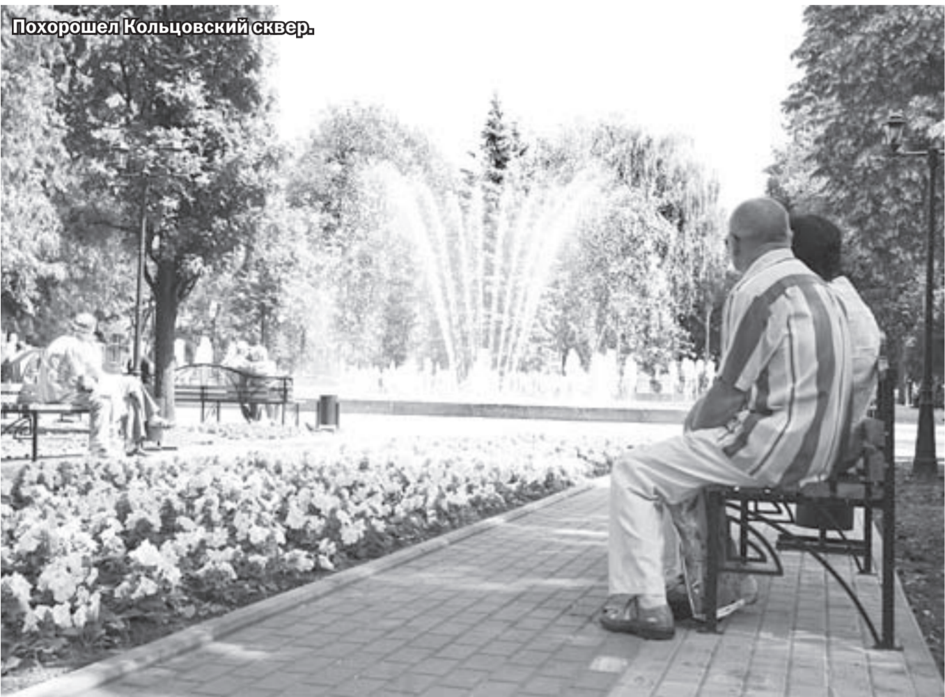
Похорошел Кольцовский сквер.

Город, в котором живём | Чтобы возродить главную «зелёную жемчужину» Воронежа, требуется миллиард рублей. И... настоящий хозяин