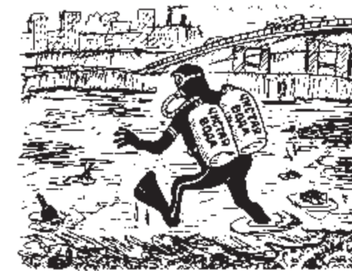
ВСЕГДА НА ЭТОМ МЕСТЕ

Неблагоприятные дни и часы на период с 3 по 8 июля 6, понедельник (пик с 9 до 11 часов) 7, вторник (пик с 12 до 14 часов) Татьяна ДУБОВА, Центр инструментальных наблюдений за окружающей средой и геофизических прогнозов.