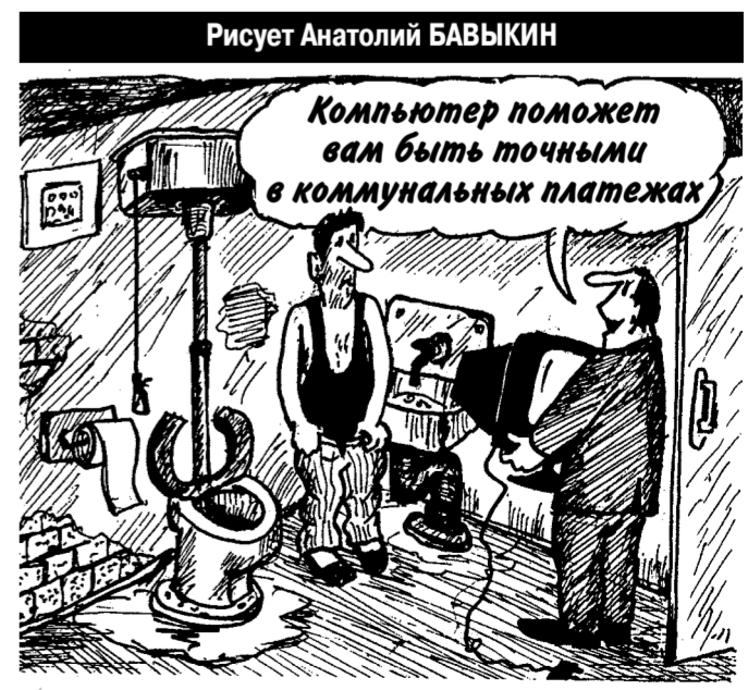
На эту тему — рядом