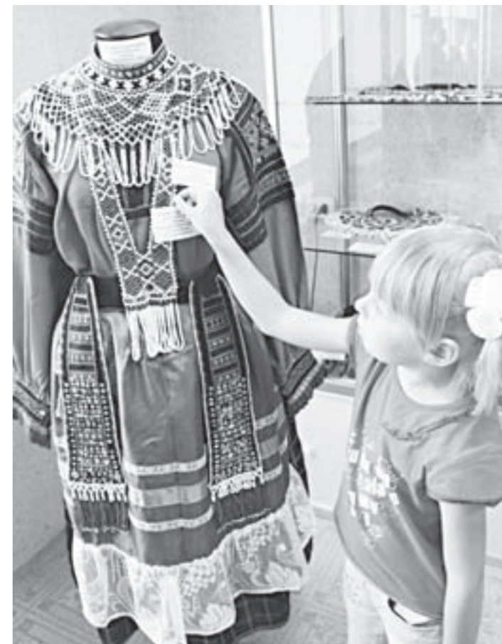
Крестьянский наряд, украшенный монисто.

Такие вот грустные коммунальные размышления.