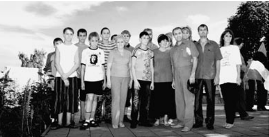
Поисковики из отряда «Бриг».