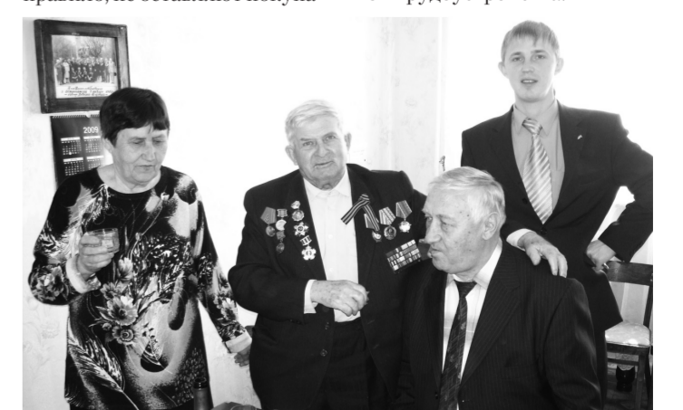
Благотворительная акция «АРД Континент» в Острогожске.