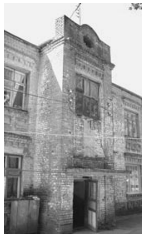
«Сталинка» в Курбатове.

Типичная «сталинка». Два этажа, но по современным меркам могло бы сойти и за три. Огромные окна, стены, хоть и не раз покрывали побелкой, настырно освещают благородным тёмно-красным цветом добротного военного кирпича.