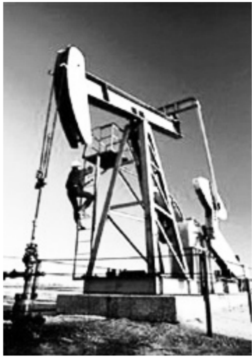
инвесторами. И, напомним, цена в 30 долларов принесла просто баснословные прибыли и операторам, и головным структурам, и прочим нефтрейдерам-офшорникам...

Конечно же, необходимо иметь в виду, что на эту прибыль ложатся разного рода эксплуатационные и прочие расходы. Речь в нашем случае идёт о нефтяных компаниях со сложившейся инфраструктурой, о проектах в стадии эксплуатации. Но ведь именно такие куски, уже освоенные и проверенные, например, «Славнефть» с её головным добывающим подразделением «Мегионнефтегаз» в 20 миллионов тонн годовой добычи, первым делом и захватывались господами частными