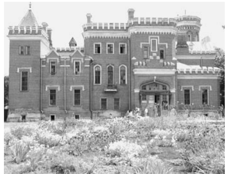
Замок принцессы Евгении Максимилиановны Ольденбургской в Рамони известен на всю страну. Он по праву мог бы стать эмблемой Воронежского края. Мог бы... Но уже многие-многое годы здесь идут реставрационные работы. Конца и края им нет.