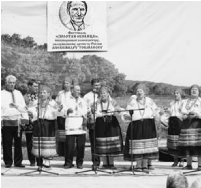
Фото из конверта

«Уважаемая «Коммуна»! В прошлую субботу я был на своей малой родине в селе Репьёвка (сам давно живу в Воронеже), где проходил областной фестиваль «Золотая околица». Он был посвящён нашему земляку, поэту и композитору Александру Токмакову. Праздник получился замечательный. Но всех буквально покорило выступление фольклорного ансамбля из села Россошь Репьёвского района. Этот коллектив я и сфотографировал.