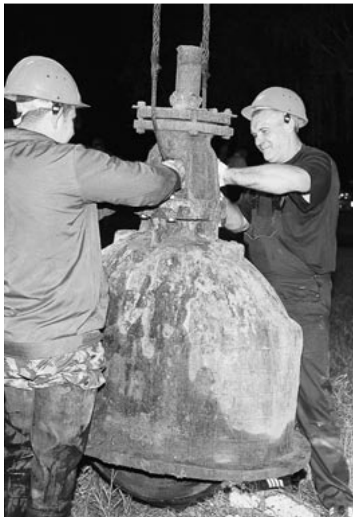
Идёт замена запорной арматуры.