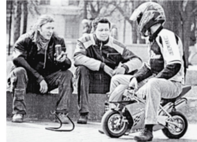
Байкеры «осваивают» вождение.

В ближайшем время владельцам автошкол предстоит пережить большие перемены. И при этом потратиться, причём, весьма ощутимо. Согласно разработанным Минобрнауки РФ новым требованиям, с 2011 года лицензия будет выдавать лишь тем организациям, которые смогут предъявить комиссиям компьютеры, программное обеспечение, проекторы, экраны и многое-многое другое. Кроме этого, каждой автошколе необходимо будет иметь учебные транспортные средства различных категорий и закрытые площадки, в том числе автоматизированные автодромы.