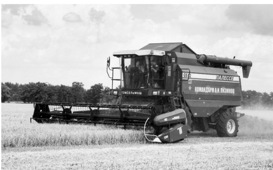
Комбайн КЗС-1218 «Командарм А.И. Лизюков» на уборке ячменя.