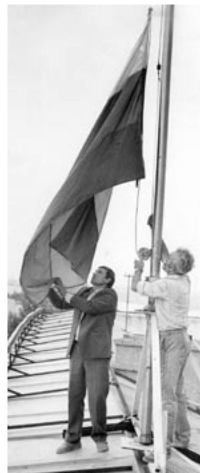
Это фото из архива нашего фотокорреспондента Михаила Вязового. Впервые над зданием областной администрации поднимают российский триколор.

мира по футболу или Олимпиада, триколоры с наших полок исчезают с космической скоростью.