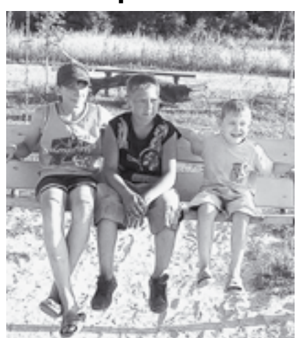
Детская площадка на улице Троицкой.

Этим летом в Бутурлиновке появилось пятнадцать детских площадок. Часть денег на их строительство выделила администрация города, остальные собрали жители и всем миром их оборудовали. Например, на улице Троицкой много места отдало под детские забавы. Здесь есть и футбольное поле, волейбольная и баскетбольная площадки, качели, карусели, песочница с красочным грибочком, стол со скамейками, деревянный «крокодил».