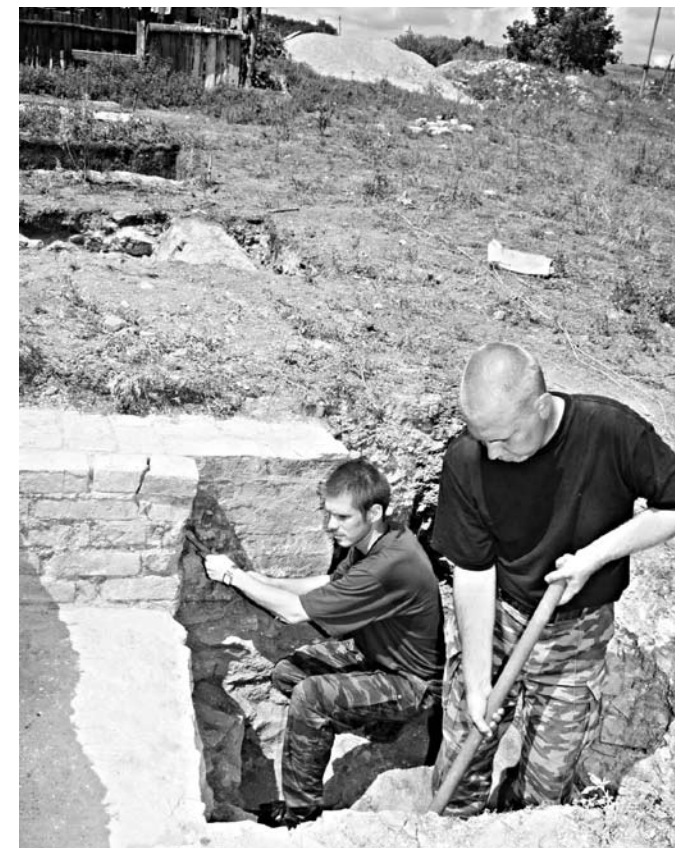
На раскопках Предтечева монастыря.

Что касается школы воспитания, то она не была для юных казаков суровой - жили