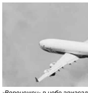
«Воронежец» в небе авиасалона.

Воронежское авиационное самолетостроительное общество (ВАСО) и авиакомпания «Поле» приняли участие в проходящем авиационном салоне МАКС-2009. Одной из машин, экспонировавшихся на выставке, стал произведенный в Воронеже ИЛ-96-400Т, названный в память умершего руководителя ВАСО «Вячеслав Саликов», который прошел все тренировочные полеты, налетав в общей сложности более четырех часов. На сегодняшний день это один из самых современных российских грузовых самолетов, максимальная загрузка которого составляет 92 тонны. При этом ни одна авиакомпания, кроме