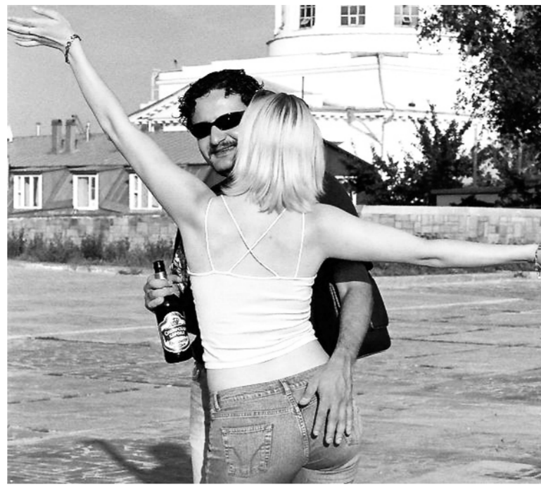
Любовь и пиво.

Подлинный взлёт начался с реформами Гайдара, который отменил государственную монополию на торговлю спиртным. На