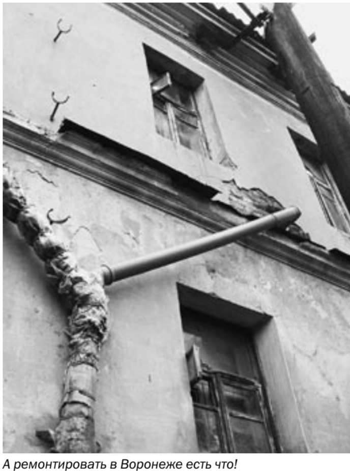
А ремонтировать в Воронеже есть что!