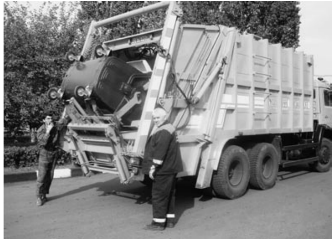
В помощь коммунальщикам — новая современная техника.