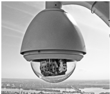
Вот она какая, телевизионная камера на Воронежской телевышке.

С 12 августа зрители воронежской сети кабельного телевидения «Теле-сервис» к своему удивлению увидели новый телеканал с необычным названием «Форум 36». Необычно было все: и то, что в непростое кризисное время кто-то решился на запуск нового дорогостоящего проекта, и то, какую картинку выдает канал. Панорамная съемка Воронежа ведется с высоты 150 метров, при этом единственное место, откуда возможна такая съемка, - телевизионная башня, уже более полувека являющаяся привычным символом в силуэте города. Раз так, то в первую очередь надо обратиться к телевизионщикам, работающим на башне.