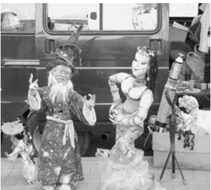
И такие куклы, в рост человека, были на фестивале.

– Вообще-то, исконно старооскольскую игрушку всегда делали из белой глины, – рассказывает Валентина Павловна.