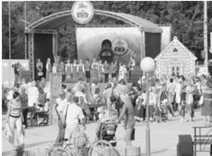
«Игрушка-говорушка» открылась песней.