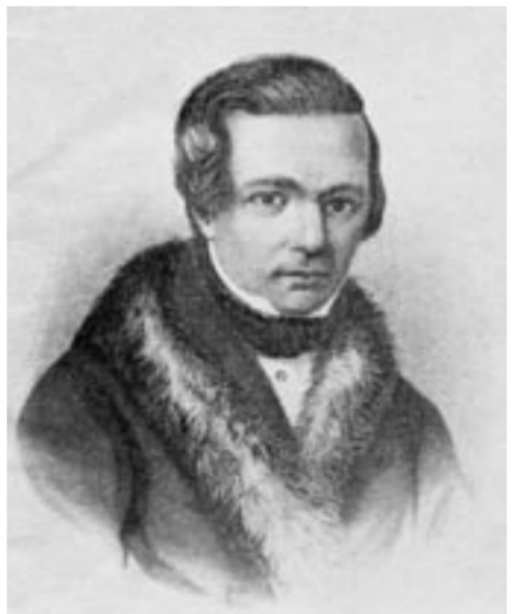
Портрет А.В.Кольцова из его полного собрания сочинений 1914 года издания.

Значит, счастье - не что-то материальное, и не во власти над людьми оно, а в даре любви, в способности приносить добро и радость другим. Кольцов чем дальше, тем ответственнее задумывается над опорными ценностями человеческой жизни, над тем, что не позволяет ей