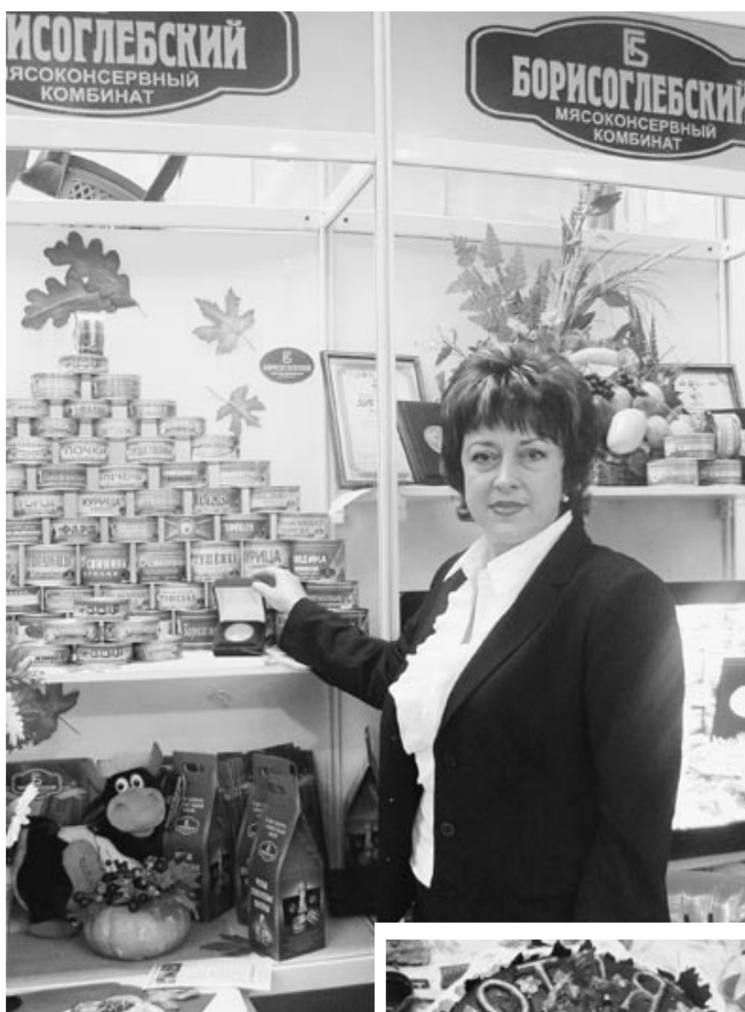
сохранил объемы докризисного периода развития, но и прибавил.

Знаменательно, что «Золотая осень» открылась накануне профессионального праздника – Дня работников сельского хозяйства и перерабатывающей промышленности. К нему воронежские аграрии подошли с серьезными достижениями. Они участвуют в реализации национального проекта «Развитие АПК», создают собственные инновационные программы развития села, апробируют перспективные технологии, укрепляют традиционные формы крестьянского жизненного уклада. В результате агропромышленный комплекс области не только