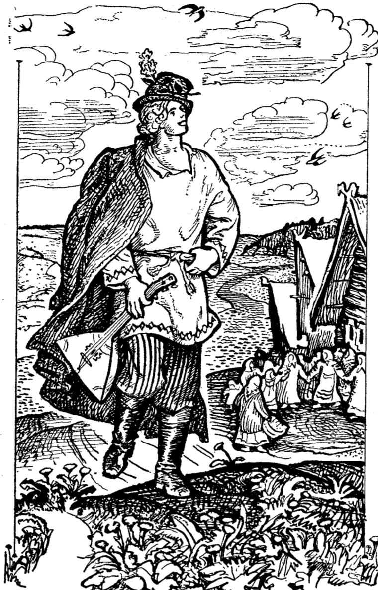
Из иллюстраций художника И.Архипова к стихам А.В.Кольцова.

Там, в далеких эфирных мирах, мы могучи, важны и значительны, там мы на все способны и все можем осуществить, потому что всего достигаем мечтой и словесными по-