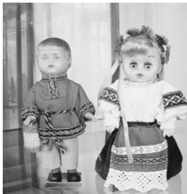
... и её куклы.