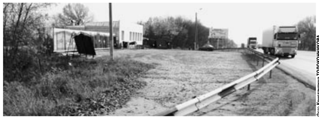
Теперь торговый павильон окружает стальной барьер.

Через несколько дней пришла повестка от мирового судьи Новоусманского района. По иску дорожников было заведено дело об административном правонарушении.