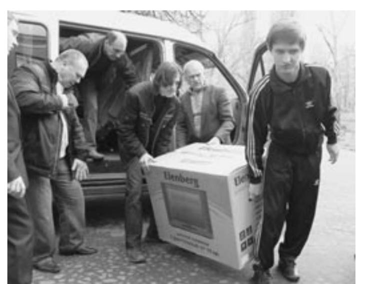
Такой большой телевизор станет в библиотеке доступен для всех воспитанников школы-интерната.