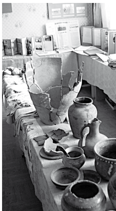
Экспозиция школьного музея.

по количеству учеников, то денег даже на зарплату не хватит. Тогда и статус школы может измениться. Из полной превратится в неполную, девятилетку. Будут родители возить детей в Петропавловку за 25 километров, а то и больше. А как надетое эдакое, переберутся в райцентр жить. Что тогда станет с сёлами? Думаю, и без меня всем ясно.