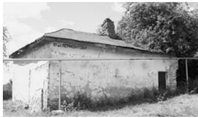
Так сейчас выглядит «лермонтовское место».