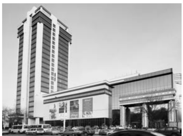
Вид из смотровой площадки «Центра Галереи Чижова»