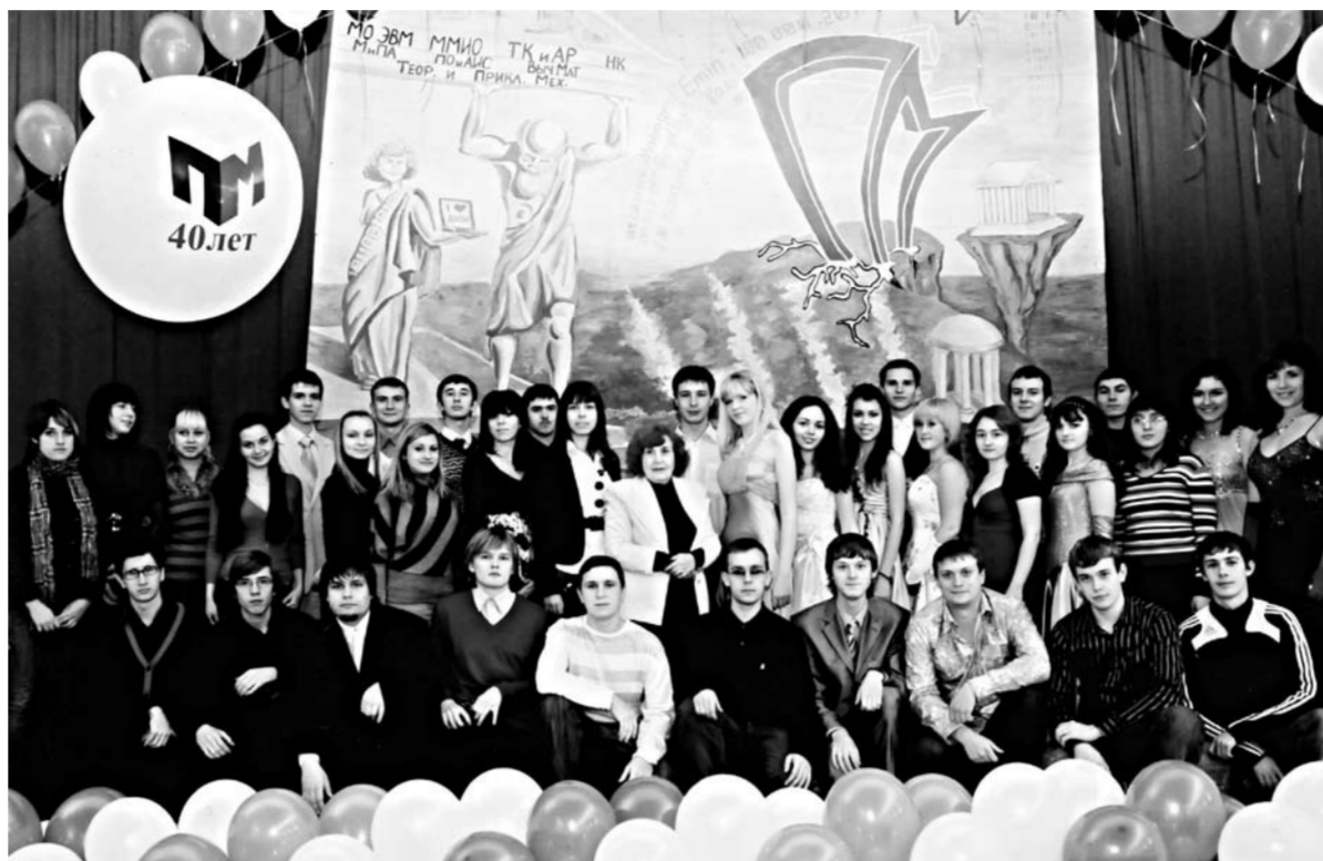
Фото на память - студенты ПММ.