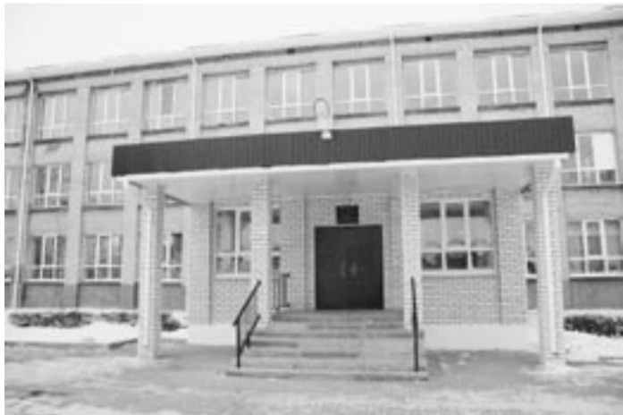
Обыкновенная поворинская школа.

Пресс-центр губернатора и правительства области.