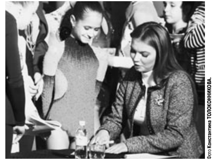
Фото Коммуны ТОПОСНИКОВА.

Говорят, правда, что у нас тоже есть профсоюзы. И даже депутаты есть - как бы избранные населением. Народом. Не слышали?