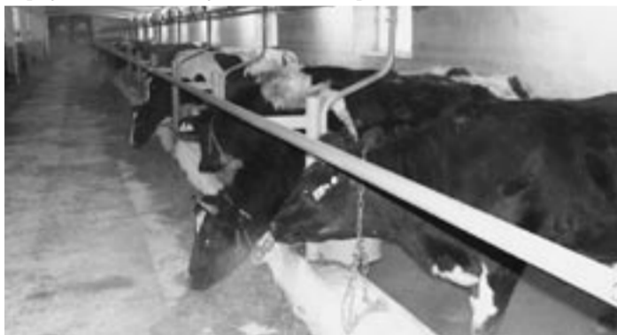
В новом животноводческом корпусе.

ООО «Россия-Агро» можно назвать «первой ласточкой» по возрождению молочного животноводства в Грибановском районе. Хозяйство за счет собственных средств сумело завезти из Белоруссии к имеющему стаду красно-пестрого скота 89 нетелей черно-пестрой породы. Их продуктивность — около 500 килограммов молока от коровы в год. С появлением нового поголовья началась модернизация молочного корпуса на 200 голов скота. Специалистами известной немецкой компании ГЕА «Вестфалия Сердж» было смонтировано оборудование для доения коров, охлаждения молока, проведен молокопровод. В декабре «иностранки» из Белоруссии справились новоселье в обновленном корпусе. У 14 из них уже появился приплод.