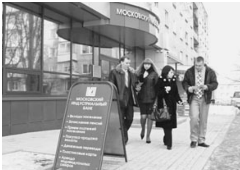
Черемушки, 1 — этот адрес уже хорошо знаком жителям Павловска.