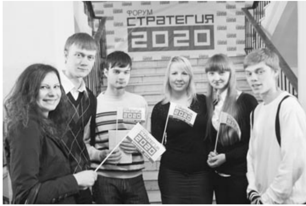
Им выполнять «Стратегию-2020».