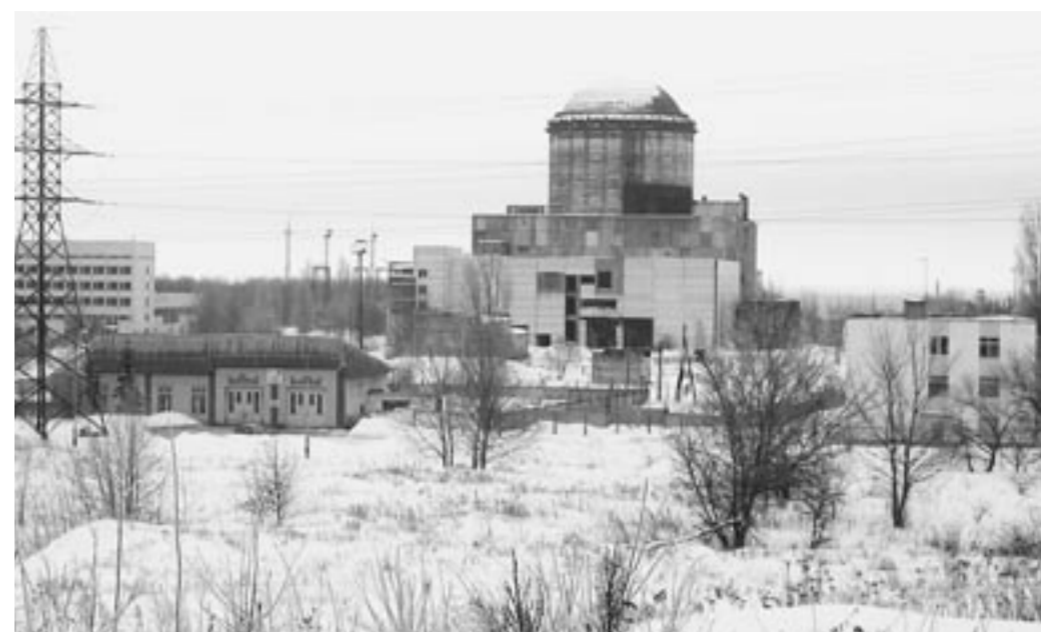
ВАСТ на «точке замерзания».

Что же, на мой взгляд, не хватает в дебатах о строительстве Воронежской АСТ, которые периодически появляются в СМИ? Во-первых, во многих интервью, беседах, статьях проигрывается непрофессионализм авторов. После прочтения статей-пугалок у читателя