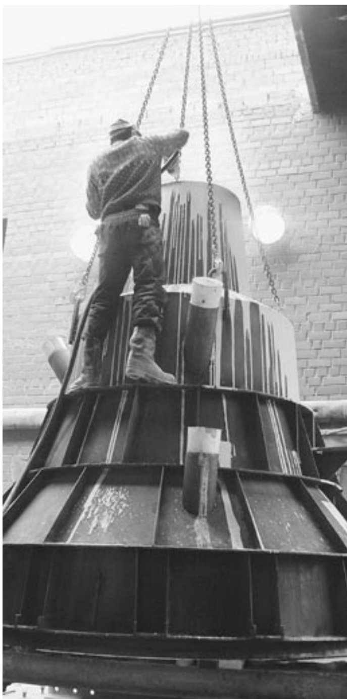
Так рождается колокол.

Колоколотейный завод фирмы «Вера» основан в 1989 году, став первым специализированным производством колоколов в современной России