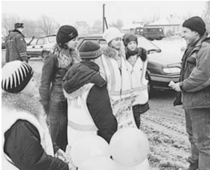
Профилактическую работу ведут юные инспектора дорожного движения.

Сотрудники Панинской ГИБДД провели специальную операцию «Безопасная дорога», участниками которой стали учащиеся всех школ района. Не остались в долгу и дети. С плакатами, цветными шариками они «дежурили» вместе с инспекторами на самом оживленном перекрестке в Панино. Дети обратились к водителям с просьбой быть осторожнее и соблюдать Правила дорожного движения. Ребята раздавали листовки и желали доброй дороги. Юные инспектора дорожного движения детской организации «Эрудит» постоянно сотрудничают с сотрудниками ГИБДД.