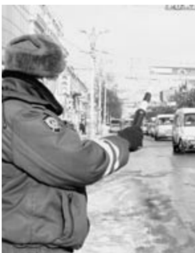
Теперь автоинспектор будет на виду.

Во-вторых, наконец-то запрещены милиционные «засады» на дорогах. Теперь сотрудникам ГИБДД запрещено прятать машины в кустах, за