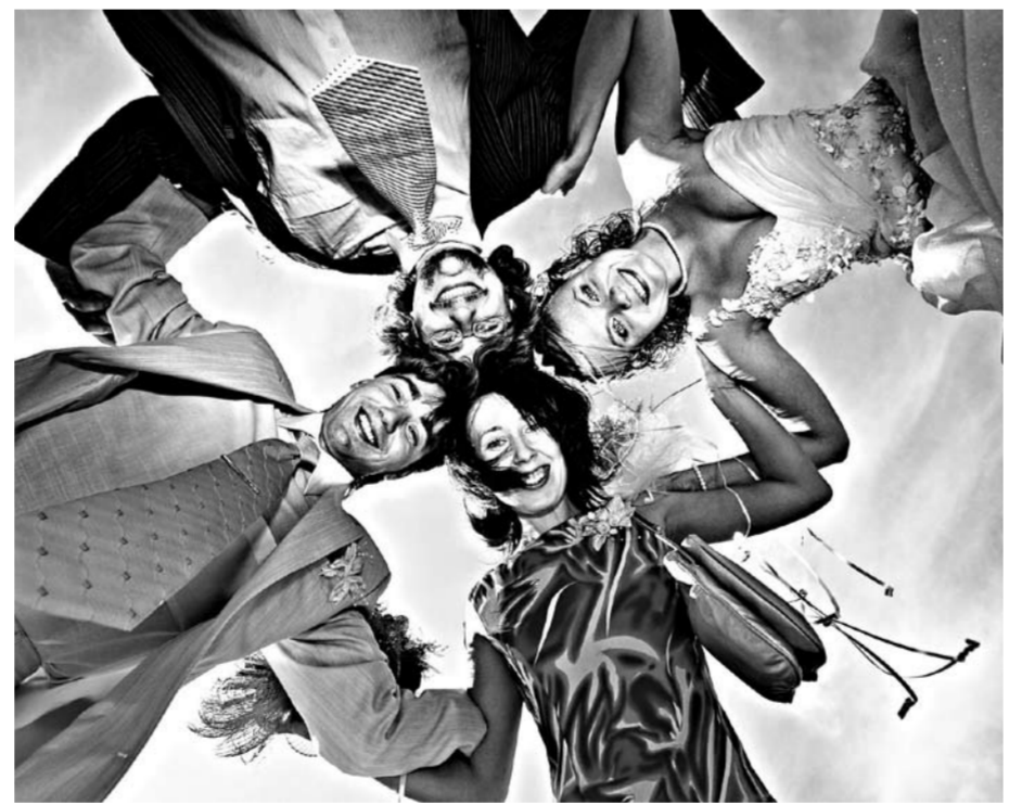
Одна из выставочных фотографий Олега Красиикова.

А хочется им — не только страстно целоваться, но и красиво отражаться при этом в зеркалах на потолке лимузины. Главная эстетика на выставке торжествует. Как-то так вышло у профессионала Красиикова, что в шикарных свадебных костюмах подчас неотличимы друг от друга лица их носителей. Хотя иногда что-то кажущееся важным вдруг промелькнёт в глазах его персонажей — например, у той невесты, которая оглянулась и посмотрела прямо в объектив перед тем, как войти в дверь, за которой ждала её какая-то, очень хотелось верить, новая и счастливая жизнь.