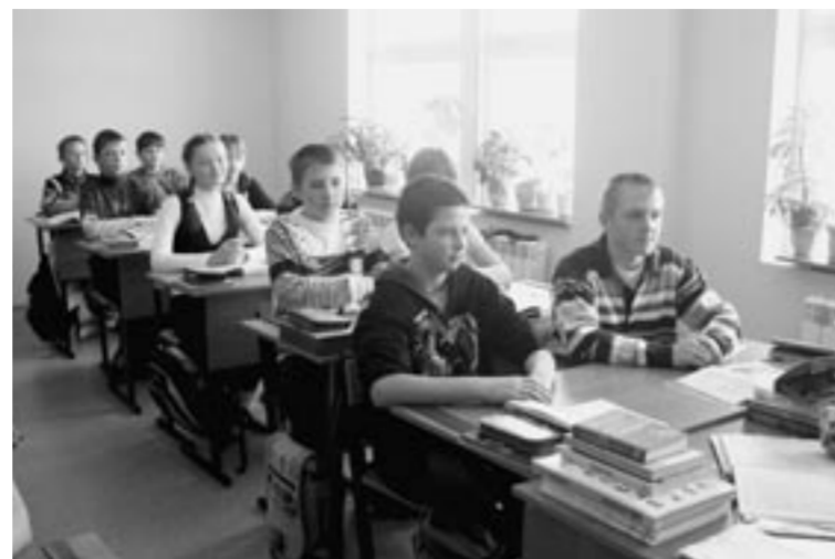
Начало занятий в новом классе.