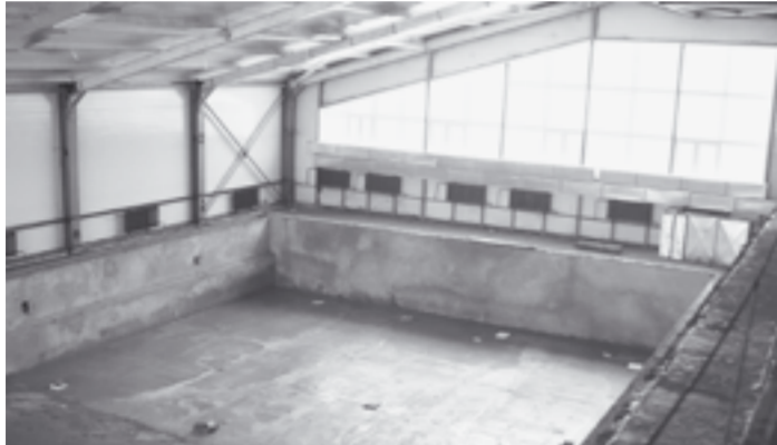
Скоро бассейн наполнят водой.

В конце 2008 года в Северном микрорайоне Острогжска было начато строительство нового плавательного бассейна. В конце августа прошлого года по причине неудовлетворительных темпов был расторгнут контракт с подрядной организацией, прежде занимавшейся его возведением. Вновь проведенный аукцион выиграла Воронежская организация ОАО «СРСУ-7». В течение нескольких месяцев со дня заключения контракта на достройку бассейна работы на этом объекте идут полным ходом. Освоены и дополнительные средства, выделенные из областного бюджета - 13 миллионов рублей. Сделано главное - подведены инженерные сети: водопровод, канализация, теплообогрев, электричество. Появилась кровля, закрыт контур бассейна, вставлены окна. Это позволяет вести отделочные работы в помещении. Поступило и монтируется технологическое и вентиляционное оборудование.