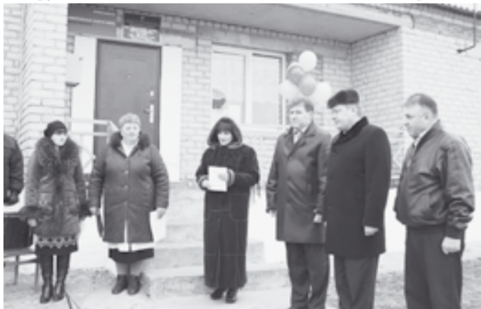
Открытие фельдшерского пункта в Кривой Поляне.