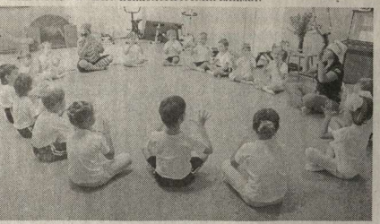
Физкультминутка в детском саду.

В детском саду успешно проводится целый цикл занятий из серии «Моя семья», «Откуда я появился». Здесь стали привычными пальчиковая гимнастика, игровые упражнения по формированию устойчивых культурно-гигиенических навыков, дыхательная гимнастика, самомассаж, точечный массаж. Всё это и оздоравливает дошколят, и доставляет им удовольствие, и поддерживает благоприятный эмоционально-психологический климат.