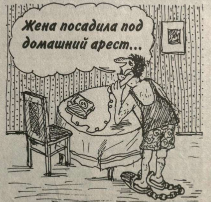
На эту тему – рядом