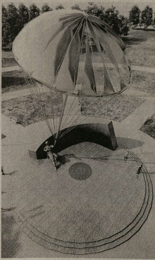
Это один из проектов, представленных на конкурсе. Какой памятник ВДВ увидят воронежцы в жизни, пока не ясно.