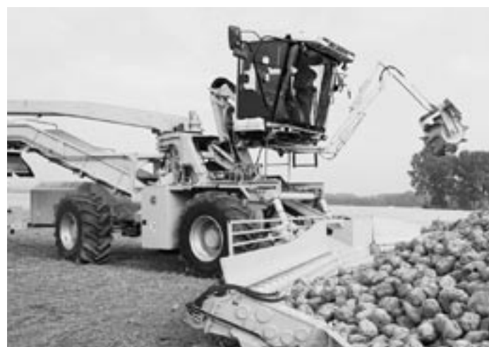
Погрузчик RL 350 V в работе.

машин в самую горячую пору их работы на полях. Создание региональных складов, в том числе и в Воронежской области, свело время доставки запасных частей до минимума. Надо заметить, что хозяйство, купившее технику «ФК АГРО», не остаётся без помощи специалистов этой компании, которые обучают механизаторов грамотному обращению с этими машинами. Теоретические знания обязательно подкрепляются практическими навыками. Сами специалисты сервисной службы, которая разделена на бригады, закрепленные за конкретным регионом, участвуют в пусконаладочных работах и контролируют техническое состояние комбайнов на протяжении всей