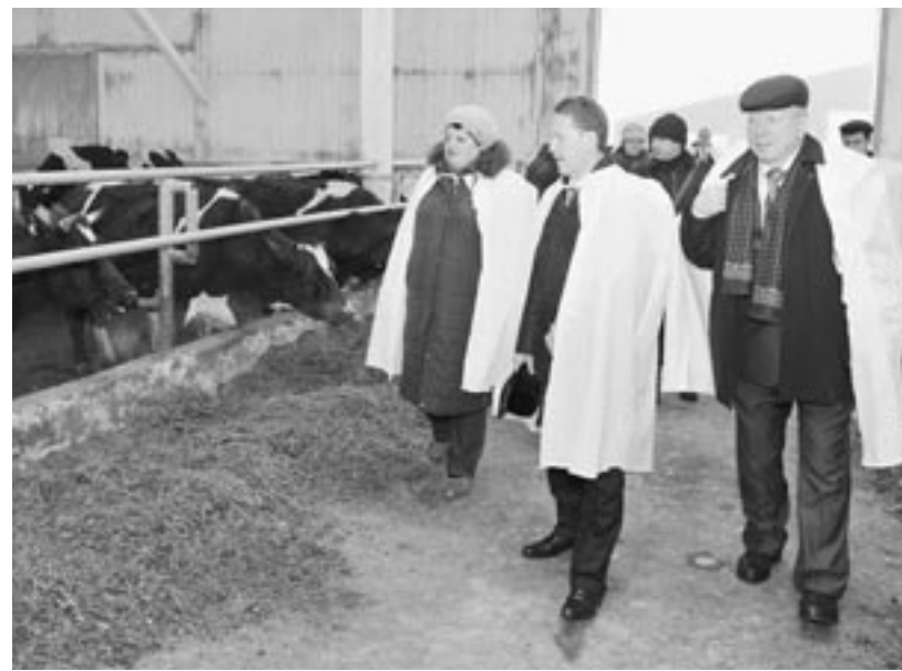
Губернатор посетил СХА им.Мичурина.

А вот сами артельщики были не так довольны. Как выяснилось в беседе, их не устраивают ни объёмы закупок, ни цены. С приездом Алексея Гордеева они связывают надежды на улучшение ситуации.