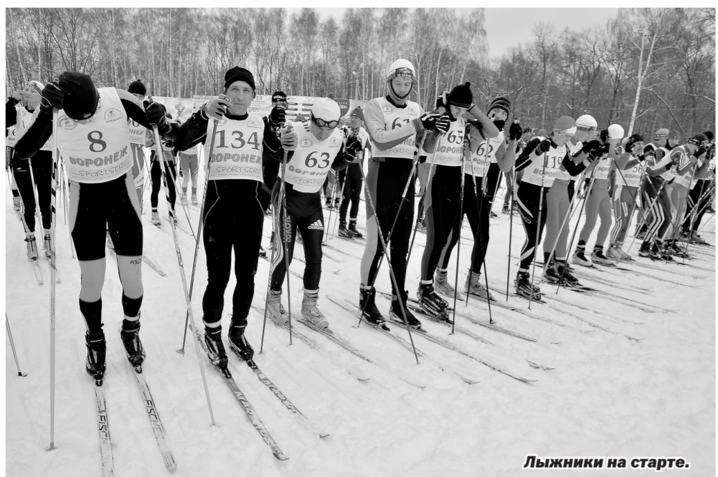
Лыжники на старте.