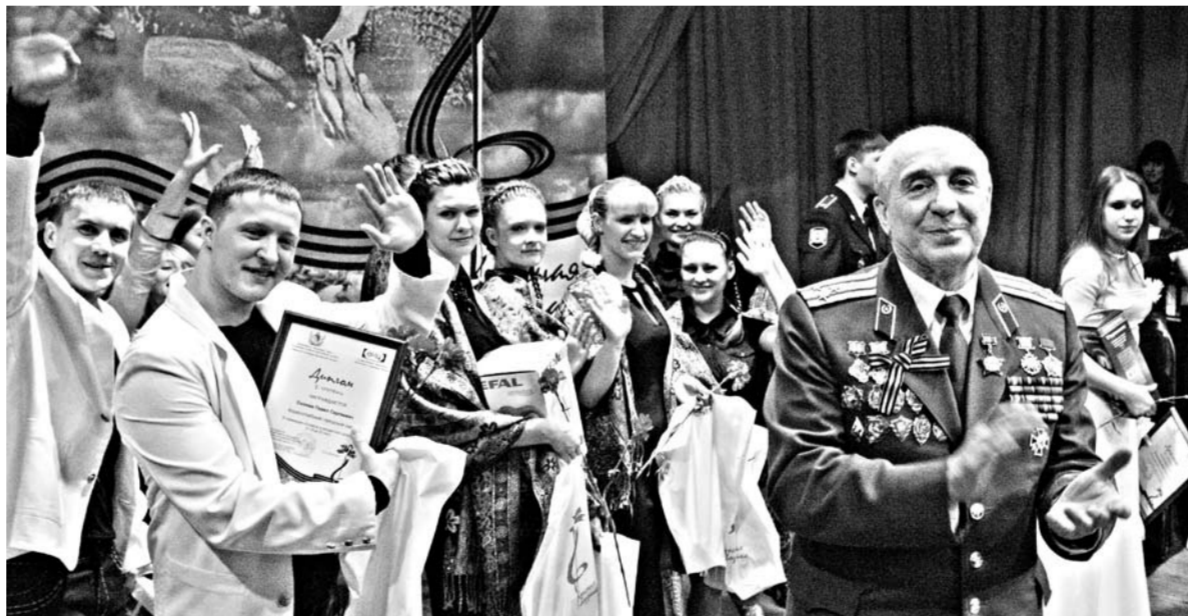
На сцене — победители «Красной гвоздики».

Патриотическая песня — изменилась ли она? Конечно, хочется, чтобы не бездушная официозность советской поры выплыла вновь в двадцать первом веке, а уцелела и продолжила развиваться линия патриотизма («человеческим лицом»; негромкого, лишённого внешнего пафоса. Иногда и браурные марши нужны, но баллада или вальс подчас гораздо действеннее. Вообще что делать с накопившим при Советской власти пенным наследием, не совсем ясно. Со времён горбачёвской перестройки едва ли не единственным, в чьём исполнении давние песни о войне не звучали пошло, оказалась покойный Егор Летов: для сравнения послушайте хотя бы его версию «Воздушных рабочих войны», а затем посмотрите любой «звёздный» концерт по телевизору в дни государственных праздников. Но телевизор-то молодые исполнители из провинции наверняка смотрят, а вот в том, что многие из них слышали альбом